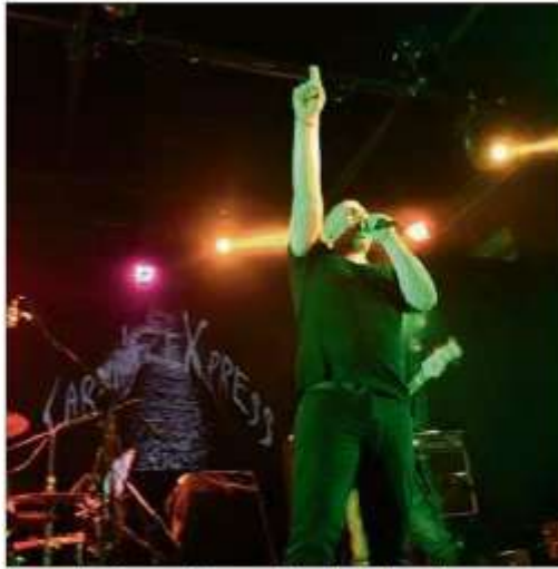
Karma's eXpress, le samedi 29 juin à 22 h 15.