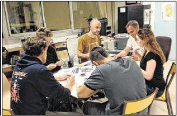
Les différents groupes avaient pour objectif de convaincre le jury. Pari réussi !